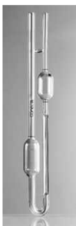
Tubo en U /BS

Adecuado para líquidos transparentes. Con certificado de calibración a 40 °C y 100 °C. Longitud total 300 mm. Aforos permanentes en color ámbar.