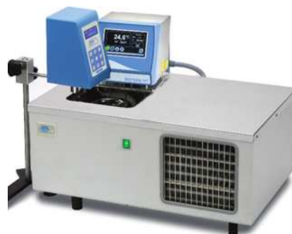
Baño termostático FRIGITERM con el kit de adaptación código 1001625 para trabajar junto al viscosímetro rotacional.

Es necesario configurar los termostatos de inmersión para recirculación externa del líquido. No es necesario el “kit de adaptación a baño termostático”.