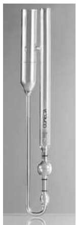
Tubo en U flujo reverso

Adecuado para líquidos opacos. Con certificado de calibración a 40 °C y 100 °C. Longitud total 275 mm. Aforos permanentes en color ámbar.