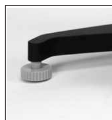
Soporte y husillos estándar L1, L2, L3 y L4 para modelos L.