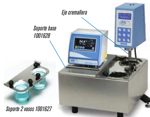
Soporte 2 vasos 1001627