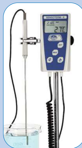
REGULACIÓN Y CONTROL