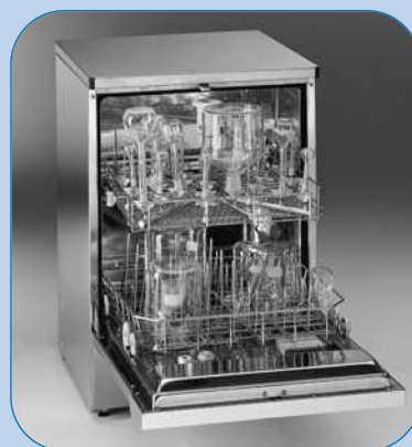
LAVADORAS DE LABORATORIO