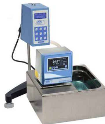
Utilización de un termostato DIGITERM para controlar la temperatura en la medida de viscosidad por medio de recirculación de líquido.