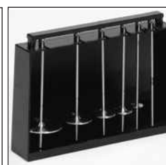
Soporte y husillos estándar R2, R3, R4, R5, R6 y R7 para modelo R. (Husillo R1 ver accesorios).