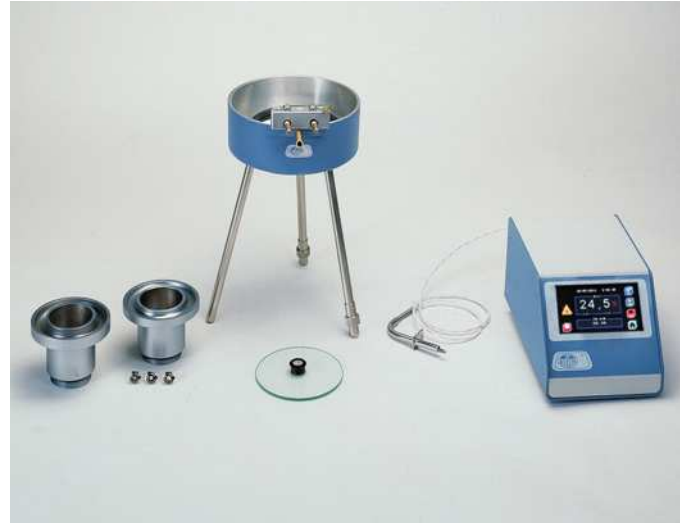
Copas para calefacción con rosca en la base para ser acopladas a baño maría y regulador de temperatura Electemp-TFT.