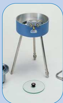
COPAS PARA MEDIR VISCOSIDADES