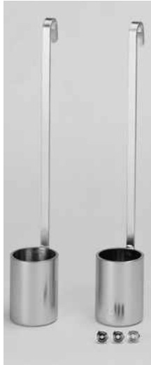
Copas con asa. Modelos DIN 53211 Nº 4 y Ford ASTM D-1200.

Para viscosidades cinemáticas desde 5 hasta 700 cSt, según modelo. Copa metálica estampada en latón, calibrada y cromada.