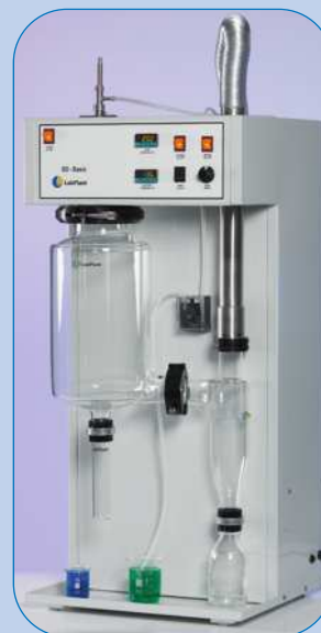
SECADOR DE SPRAY

Viscosímetros rotacionales Copas para medir viscosidad Baño para viscosímetros de vidrio Viscosímetros de vidrio Aparatos para regulación y control Termómetros de vidrio Reactores para planta piloto Destilador molecular Ultratermostato y criotermostato Lavadoras para laboratorio Secador de spray Filtración División analítica