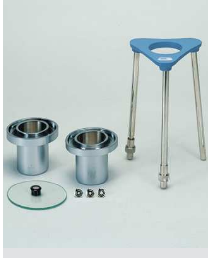
Copas. Modelos estándar.